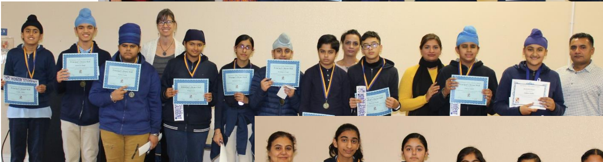
7th Grade (Bugni)