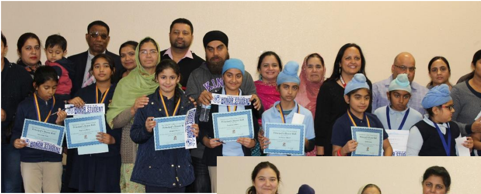
4th Grade (Champlin)