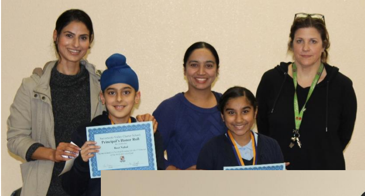
6th Grade (Phillips)