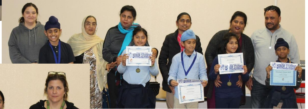
5th Grade (Koven)